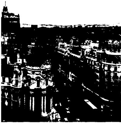
ESMO Kongress 2014 ▶ S. 596