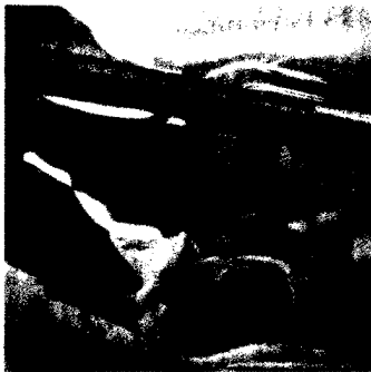
Eine Hochfrequenzbeatmung von Frühchen wirkt bis ins spätere Adoleszentenalter positiv.