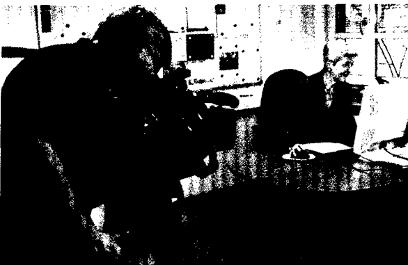
DGHS-Präsidentin Elke Baezner bei der Arbeit im Berliner Büro.