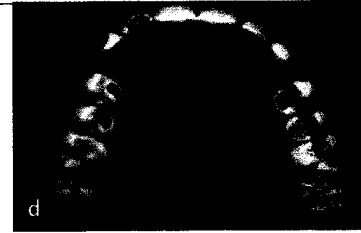
CAD/CAM-gefertigte Präparationsschienen geben in der klinischen Situation das Ausmaß der selektiven minimal-invasiven Präparation vor. ► Seite 15