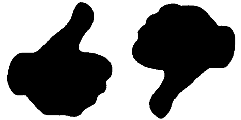
Arztbewertungsportale: „Wie steht es um IHREN Ruf im www?“ ▶ 210