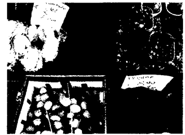
Jerzy Sawluk pixelto.de