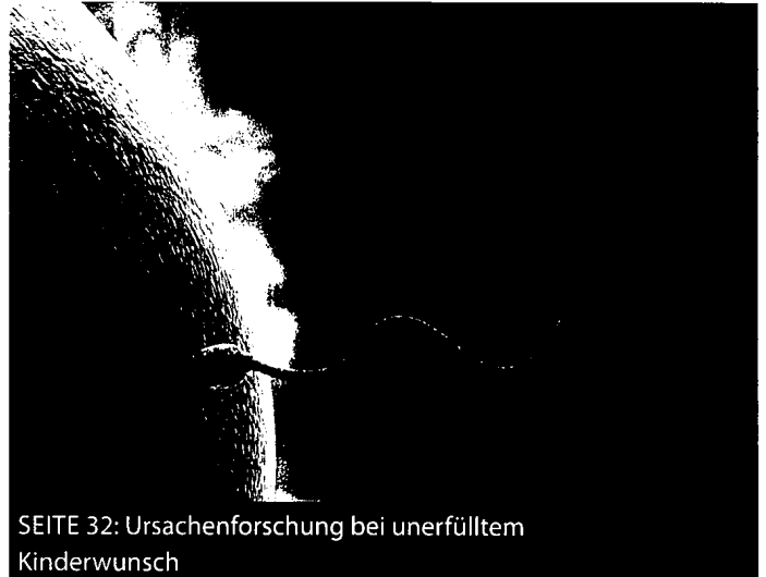
SEITE 32: Ursachenforschung bei unerfülltem Kinderwunsch