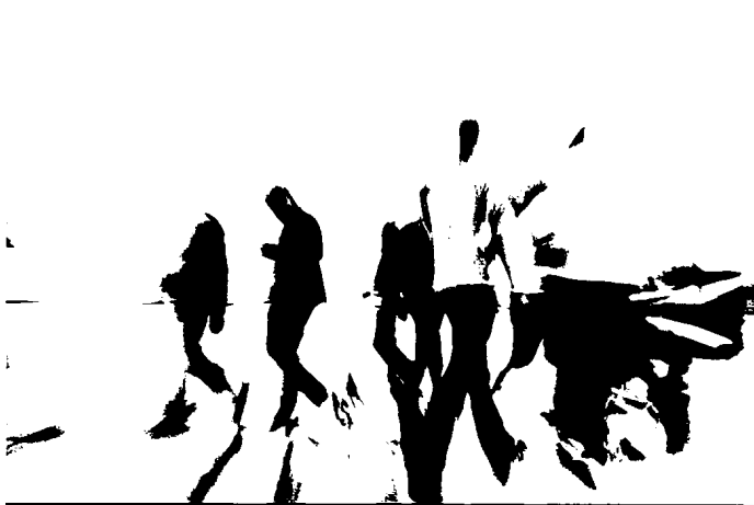
SEITE 14: Medizin und Pharma im Zeichen des Individualisierungs-Gebots