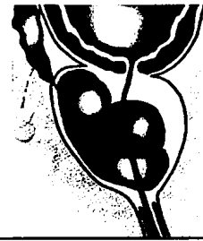
76_Chronische Prostatitis in der Pathophysiologie der BPH