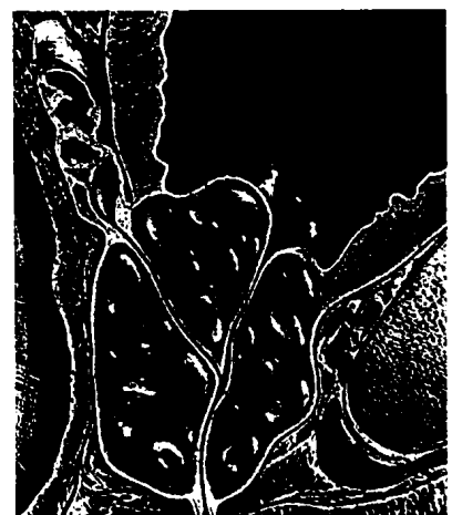
Titelbild: Vergrößerte Prostata