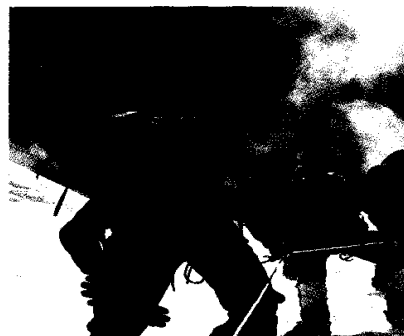
Implantologie – Emotionen und Partnerschaft