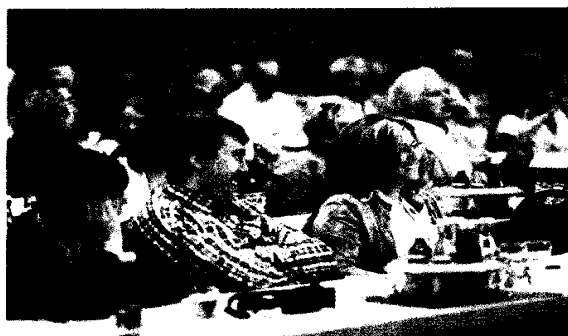
Gemeinsam mehr erreichen