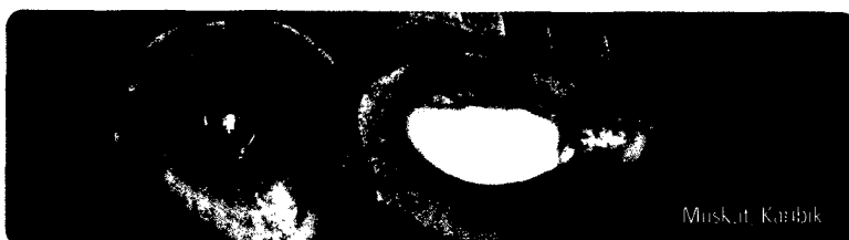
Titelseite: Bearbeitung: Anita Hohler, Pflaum Verlag; Foto: „Wilde Malve“ Karl F. Liebau