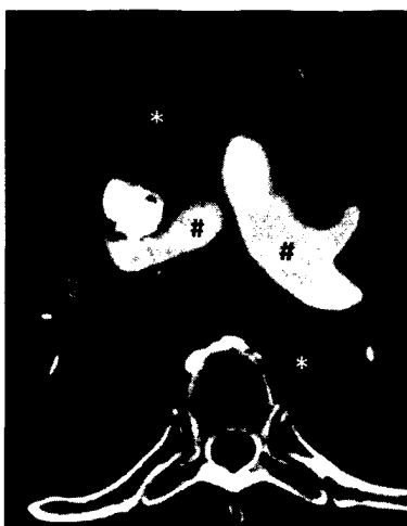
Fehlkontrastierung der Aorta (*). Das Kontrastmittel steht noch in den Pulmonalarterien (#) ► Seite 212