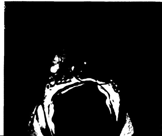
54_Perineale Fusionsbiopsie – eine erweiterte Prostatakarzinomdiagnostik