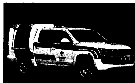
„Wolf“ Amarok-NEF in Braunau