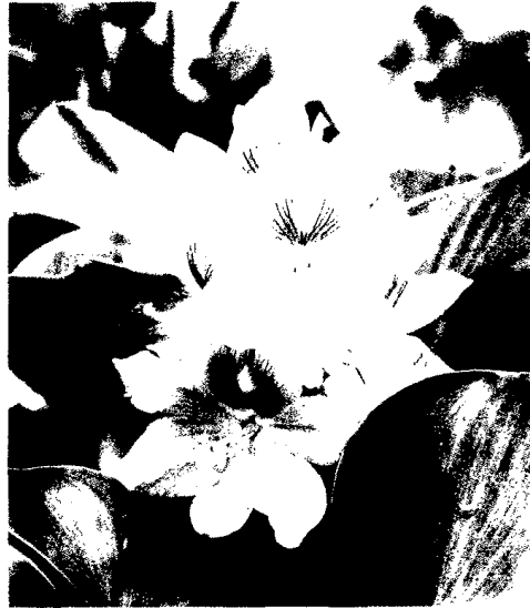
Titelfoto: Wasserhyazinthe (Eichhornia crassipes)