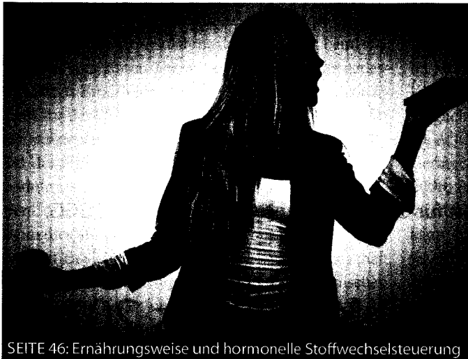
SEITE 46: Ernährungsweise und hormonelle Stoffwechselsteuerung