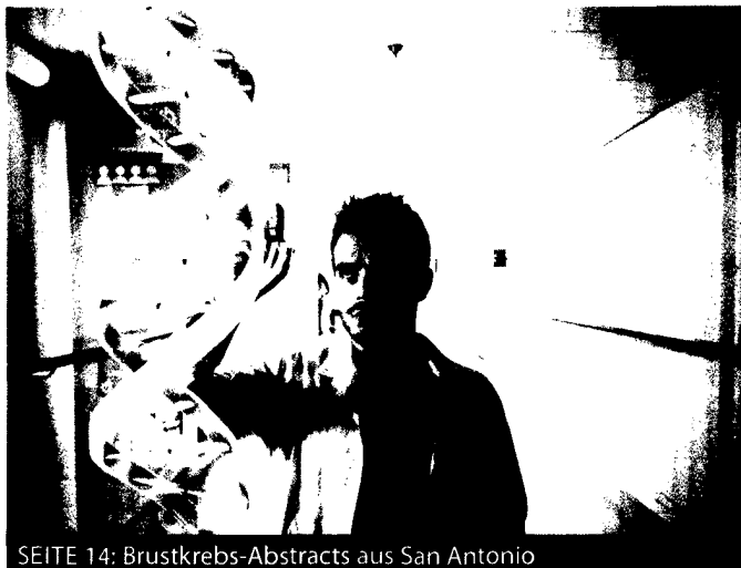
SEITE 14: Brustkrebs-Abstracts aus San Antonio