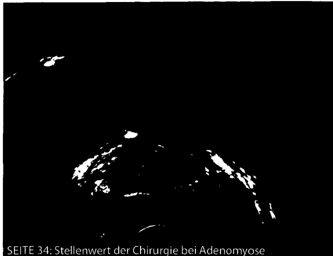
SEITE 34: Stellenwert der Chirurgie bei Adenomyose