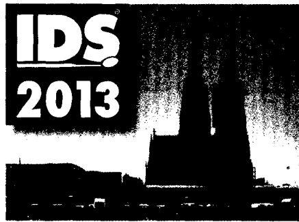
Die IDS 2013: Innovationen, aktuelle Trends, Meinungen