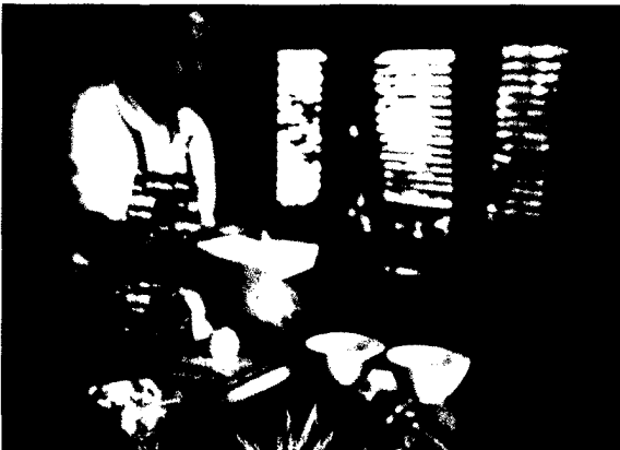
Eine gesunde und ausgewogene Ernährung ist vor allem bei älteren Menschen wichtig.