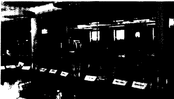
Engagieren Sie sich ehrenamtlich bei der DGHS: Impressionen vom Seminar im Januar 2013 in Berlin.