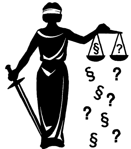
32_Interview: Bessere Werbemöglichkeiten bei Patienten nutzen