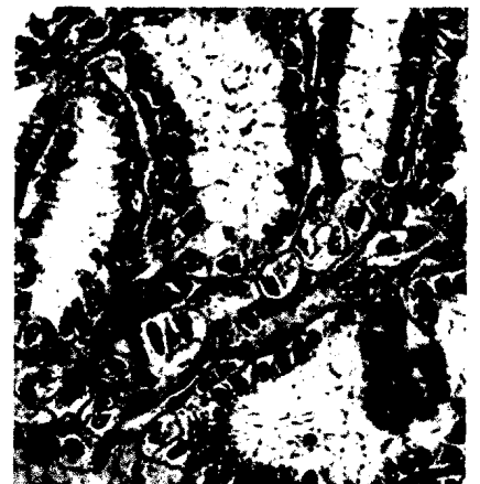
Titelbild: Papilläres Nierenzellkarzinom