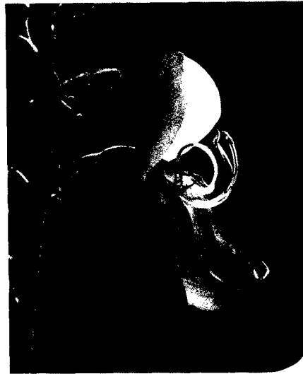
Titelfoto: Besenginster (Cytisus scoparius)