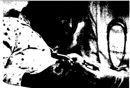
Blutzuckercheck durch den behandelnden Arzt. Bei Manifestation eines Diabetes mellitus Typ 1 gibt es keine verbindlichen Leitlinien für das Vorgehen, sofern nicht eine Ketoazidose vorliegt. ► Seite 21