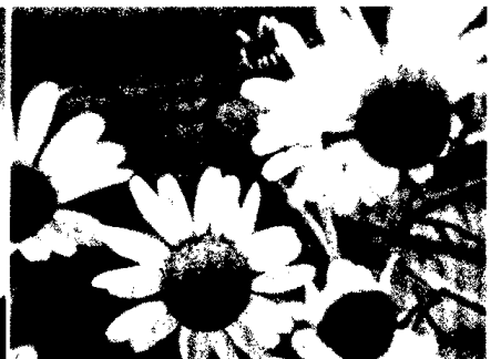
Kunigunde Stolz – Obstipation