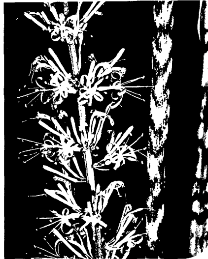
Titelfoto: Bogenhanf (Sansevieria)