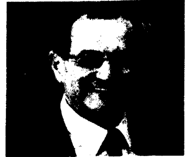
Vom Biofilm lernen