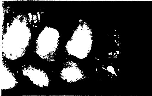
Neues CAD/CAM-Material mit hoher Kantenstabilität