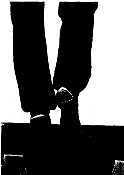
Bild: Cassel M, Weber J, Mayer F. Orthopädie und Unfallchirurgie up2date; 2012; 167-183

Profitieren Patienten mit Achillessehnentendinopathie zusätzlich zum Wadentraining von einer Eigenblutbehandlung? (S. 10)