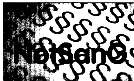
Erste Beratung zum Entwurf eines Gesetzes über den Beruf der Notfallsanitäterin und des Notfallsanitäters im Deutschen Bundestag