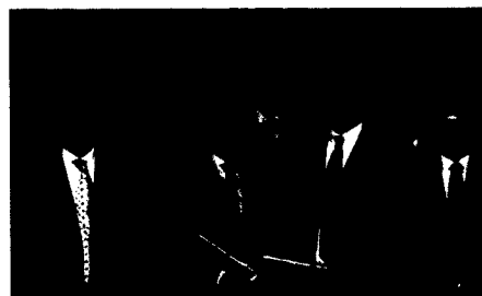
Braunwalder Erklärung bei Minister Bahr angekommen