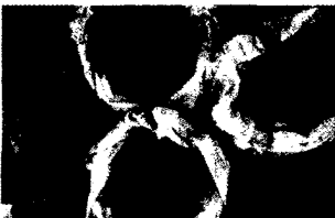
Kontaktallergien durch textile Farbstoffe (S. 474).