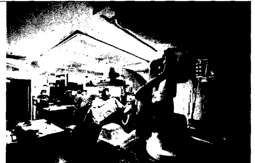
Stationäre Anlagen sind der Goldstandard in Angiographie und therapeutischer Intervention ► Seite 346