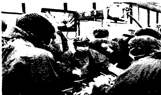
DGOI – Die besondere Fortbildung: Training an Humanpräparaten 336