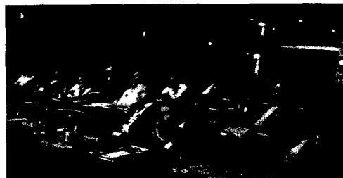
3. Nobel Biocare Symposium: Referenzpunkt Hamburg 338