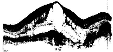
Morphologie der klassischen CNV bei AMD wie sie sich in der OCT-Aufnahme darstellt. ► Seite 749