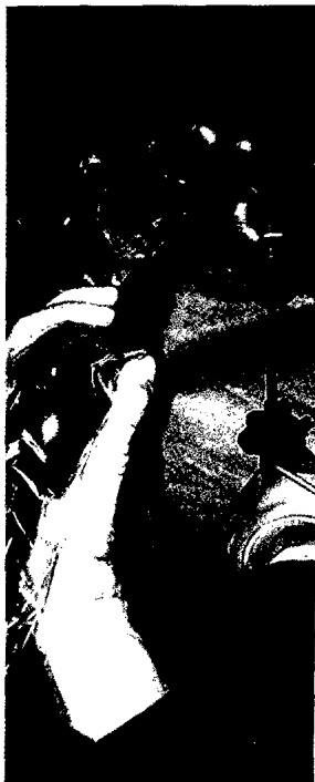
Titelbildvorlage: Port-Platzierung für endoskopische Ablation (s. dieses Heft S. 1922).