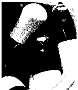
Eine hochdosierte Vitamin-D-Substitutionstherapie schützt ältere Menschen vor Hüft- und nicht-vertebralen Frakturen (s. dieses Heft S. 1895).