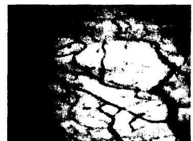
84_Blasenschmerzsyndrom oder Interstitielle Cystitis?