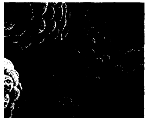
Titelbild: Prostatakrebszellen (Falschfarbendarstellung).