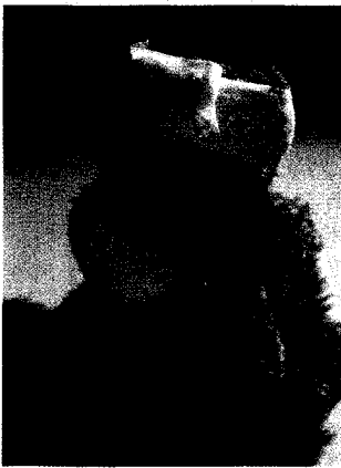
Ab einem Verbrennungsausmaß von 62% erhöht sich bei Kindern das Risiko von klinischen Komplikationen (S. 307).