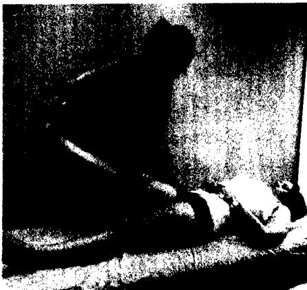
Straight-leg-raise: passive Hüftflexion bei in Extension fixiertem Knie