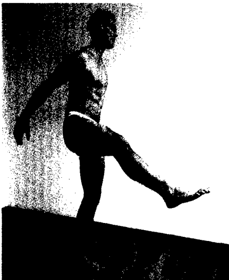
Drehmomentveränderungen des M. iliopsoas-Systems führen zu Spannungserhöhungen über den Glutäalmuskeln