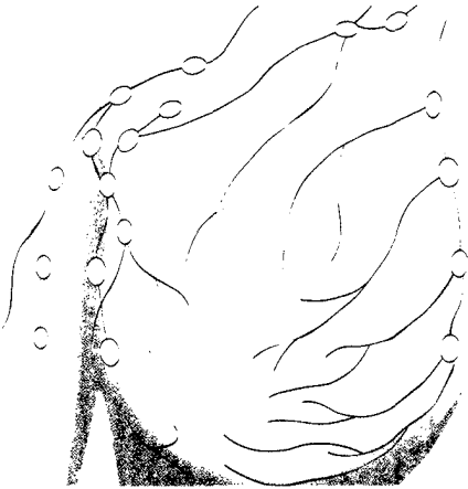
Highlights vom Senologie-Kongress 2012. ▶ S. 374