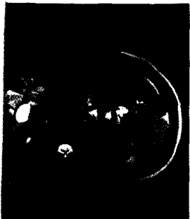
MRCP mit ca. 1,8 cm messender Raumforderung ventral des Pankreas (s. dieses Heft S. 1798).