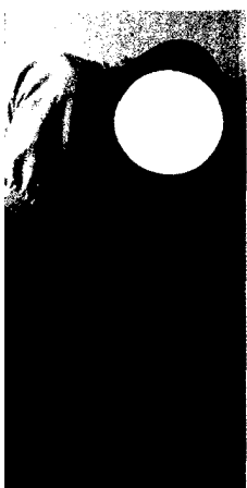
Ausgeprägte Hyperkyphose vor allem der Brustwirbelsäule (s. dieses Heft S. 1737).