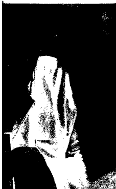
Werden „Fachärzte für Multimorbidität“ gebraucht? (s. dieses Heft S. 1727).