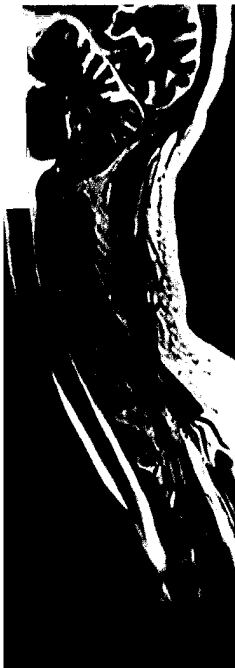
Titelbildvorlage: Magnetresonanztomographie der Halswirbelsäule (s. dieses Heft S. 1741).