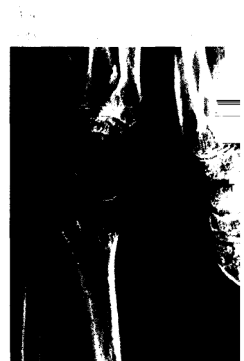
Osteoporose im Alter