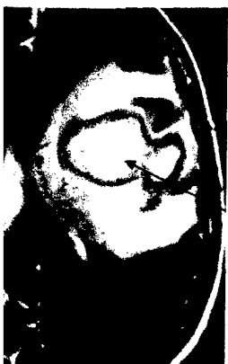
T2-gewichtete Kernspintomographie: Hirnabszess frontoparietal links (s. dieses Heft S. 1636).