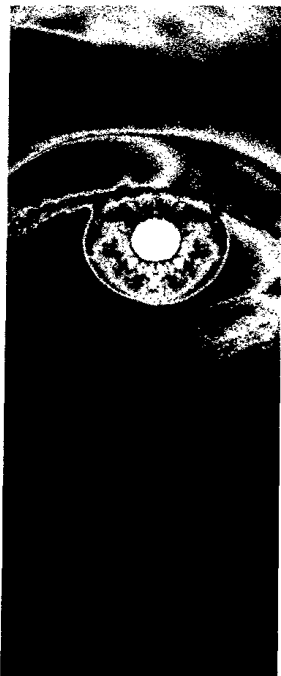
Titelbildvorlage: Symbolbild (Quelle: PhotoDisc).