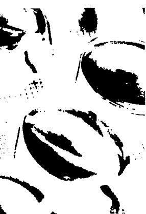
Verbessert Fischöl die Durchgängigkeit von Gefäßprothesen? (s. dieses Heft S. 1385).

1401 Eine Myokarditis mit gravierenden neurologischen Folgen Serious neurological sequelae of a myocarditis M. Schorl, R. Engling