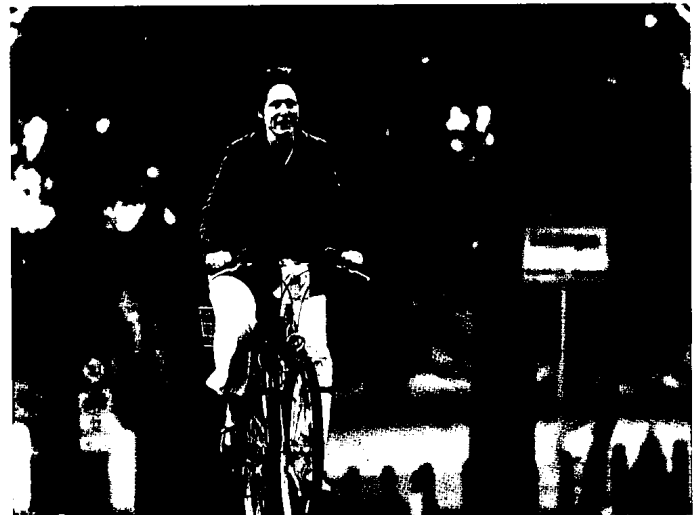
24 Ein Hauch von Färöer