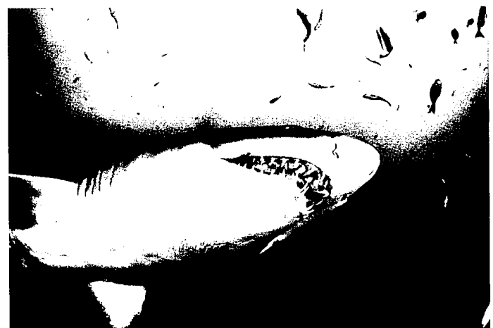
34 Auf Beutezug