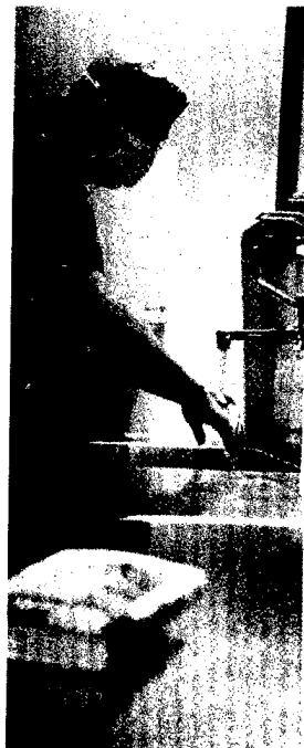
Titelbildvorlage: Symbolbild.