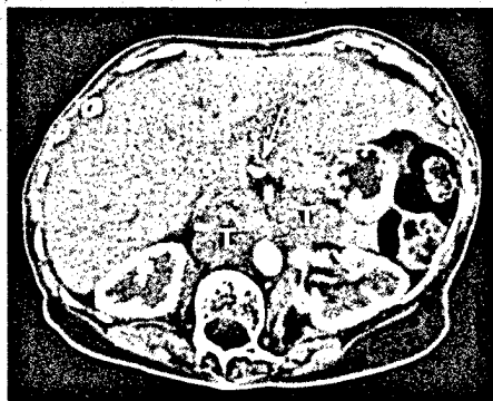
Der Tumor (T) spannt die Arteria mesenterica superior (*) nahe ihres Abgangs aus der Aorta auf.