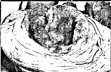
Mikrokarzinom (oben) und ausgeprägtes Zervixkarzinom