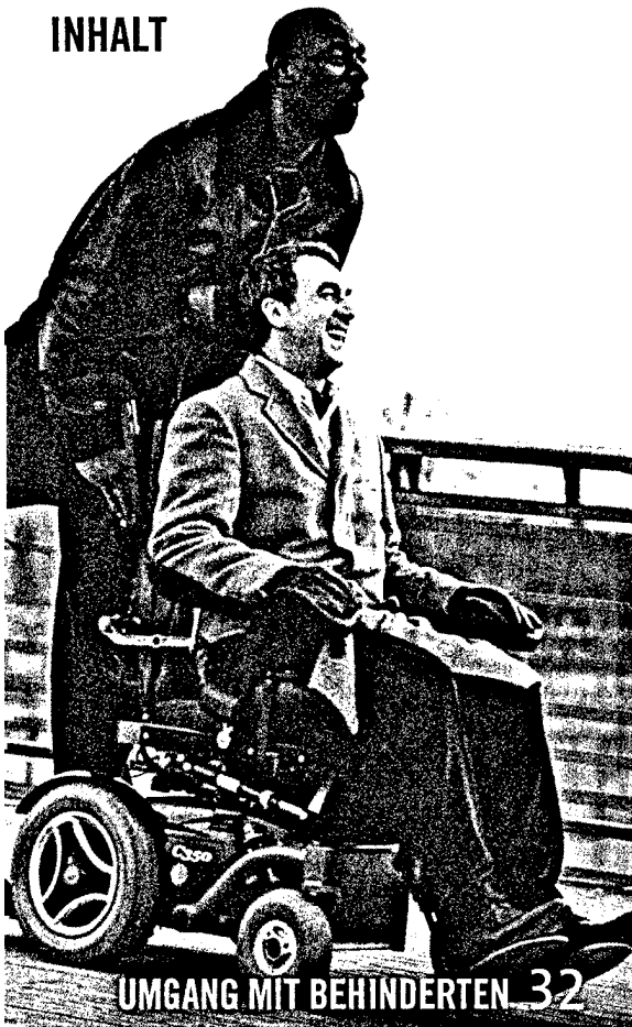
UMGANG MIT BEHINDERTEN 32