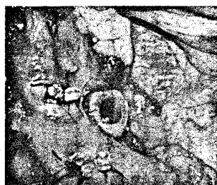
Bronchusverschluss: luftdichte Adaption der Bronchusenden durch Handnahtverschluss, S. 224