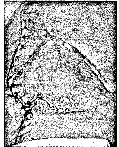
Infektionen durch Absiedelung aus dem Blutstrom stellen ein permanentes Risiko nach Prothesenimplantation dar ► Seite 496