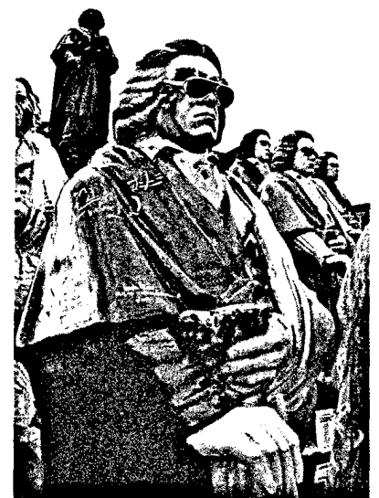
Titelbild: Beethoven-Skulpturen in Bonn