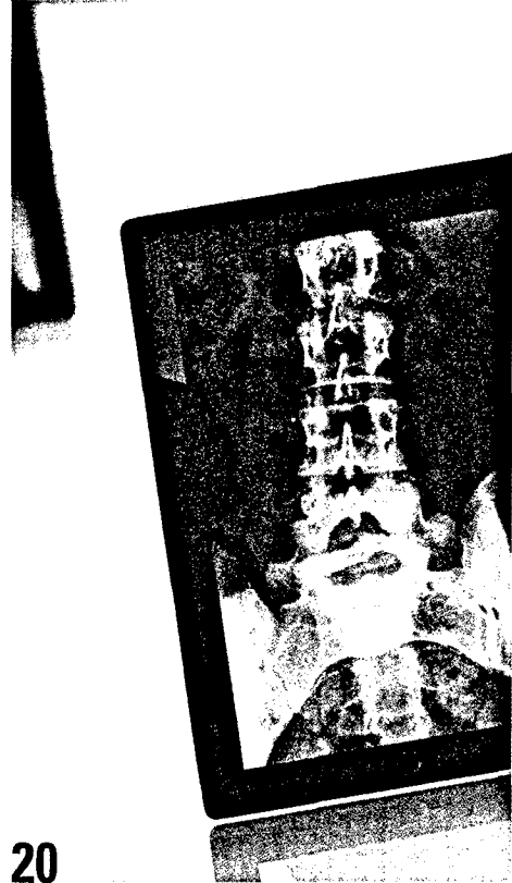
20 iPad & Co werden nun auch zur Bildgebung eingesetzt – ein echter Mobilitätsgewinn.