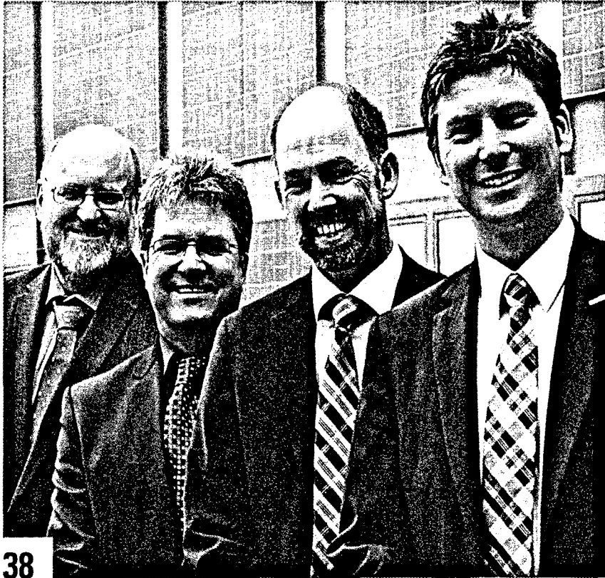
38 „Wie viel eHealth steckt in der IT der Krankenkassen?“ – Das war Thema der E-HEALTH-COM-Gesprächsrunde auf der diesjährigen conhIT mit vier Experten der Branche.