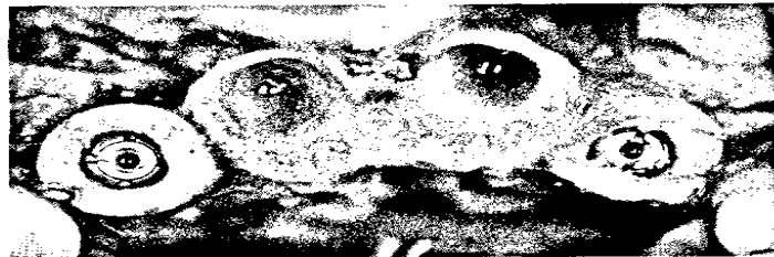
Die Knochenringtechnik 144