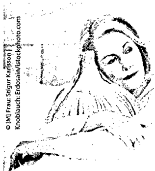
© IMI Frau Stigur Karlsson Knoblauch: Erdosain/istockphoto.com