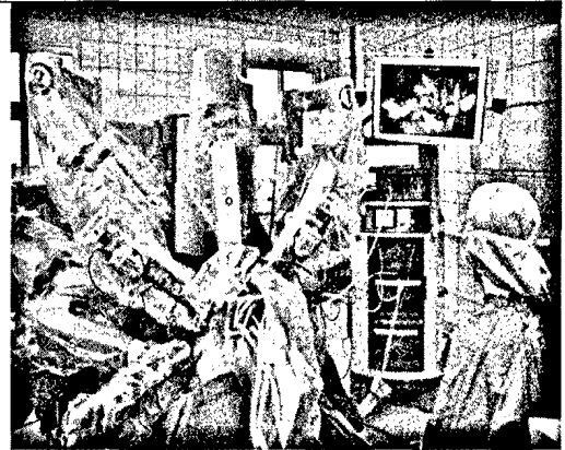
Roboterassistierte laparoskopische Operationsmethoden wie das Da-Vinci-Operationssystem sind mittlerweile weit verbreitet Seite 425